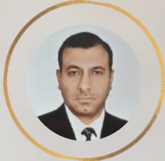
رئيس الهيئة الاستشارية